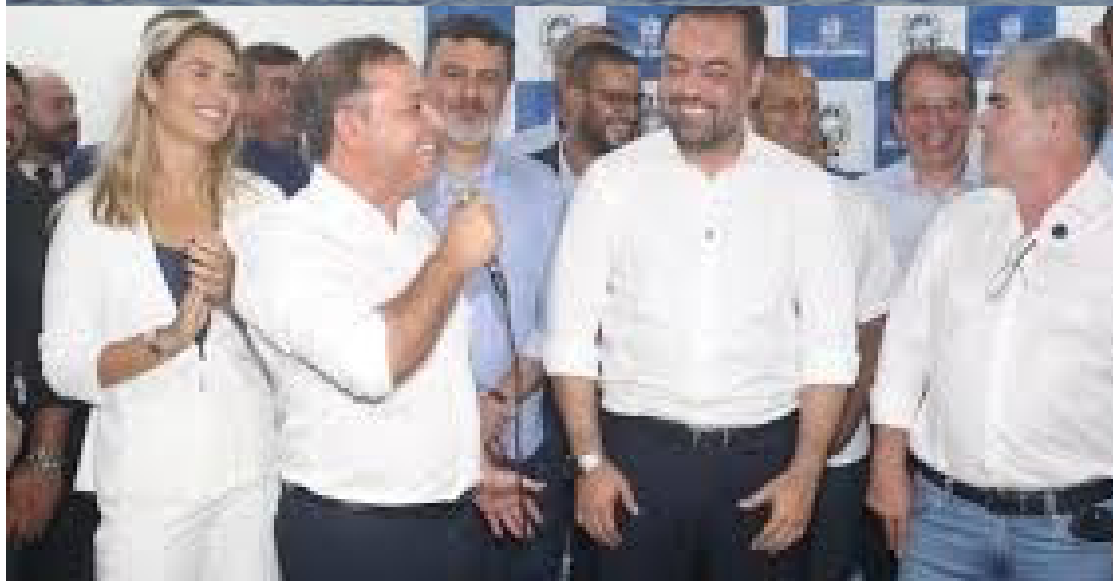
Vice-prefeita de Niterói, Isabel Swan (PV); prefeito Rodrigo Neves (PDT), governador Cláudio Castro (PL); e secretário de estado de Transportes, Washington Reis (MDB)

o sistema registrou a média de 6,3 mil passageiros por dia, quase o dobro da média do ano de 2024. No dia 11 de março foi registrado o maior movimento: 6,9 mil pessoas. O número representa um recorde de usuários da linha por dia dos últimos 5 anos, após a marca de 7.040 passageiros em 12 de março de 2020.