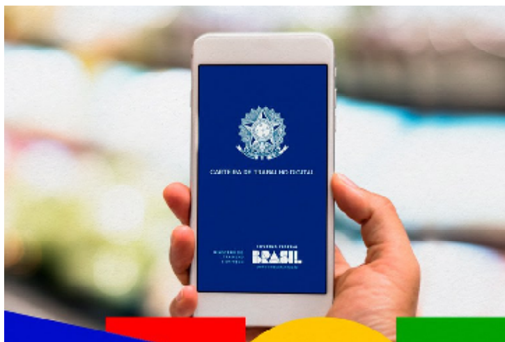
Simulações pelo aplicativo permitem acesso ao crédito em condições bem melhores para os trabalhadores formais

Emprego, Luiz Marinho. Ele reforçou que os empregados não podem comprometer mais de 35% do salário para pagar as prestações do consignado.