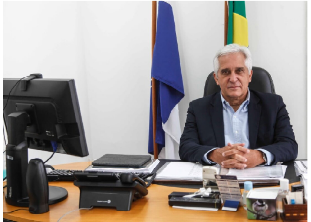
Comte Bittencourt, presidente nacional do Cidadania

O Diretório Nacional do Cidadania decidiu não renovar a federação com o PSDB, que estava válida desde as eleições de 2022. O martelo foi batido de forma unânime em reunião no dia 16, em Brasília. De acordo com o presidente do partido, Comte Bittencourt, o Cidadania ainda não decidiu se vai disputar o próximo pleito sozinho ou se vai realizar outra federação. Agora, a intenção é recuperar a identidade e definir os novos rumos, pensando nas eleições de 2026.